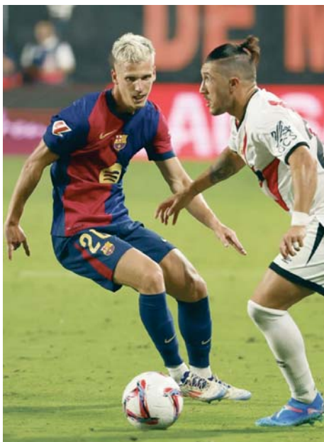
Imagen del último partido entre el Rayo y el Barça.

Flick no podrá contar con el centrocampista Fermín López, sancionado por su expulsión en el Pizjuán y que se une a la lista de bajas junto a los tres lesionados de la primera plantilla: el portero Marc-André ter Stegen, el defensa Andreas Christensen y el centrocampista Marc Bernal. Pese a todo, el entrenador germano podrá buscar el liderato con su once de gala, con Frenkie de Jong de nuevo como pivote