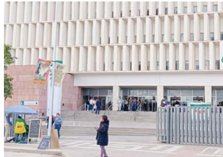
Escalera de acceso a la Ciudad de la Justicia de Málaga. ARROYO

mediante contrato privado de compraventa una vivienda en Málaga capital, "sin elevar a público el citado contrato". En septiembre de 2009, el Juzgado de Primera Instancia número 9 de Málaga dictó una sentencia en la que condenaba al acusado a elevar a público el contrato privado de compraventa "sin que se haya procedido a la ejecución de la misma por la voluntad obstativa del procesado", dice la resolución. Además, en junio de 2022, el acusado, "con ánimo de apoderamiento ilícito y teniendo cono-