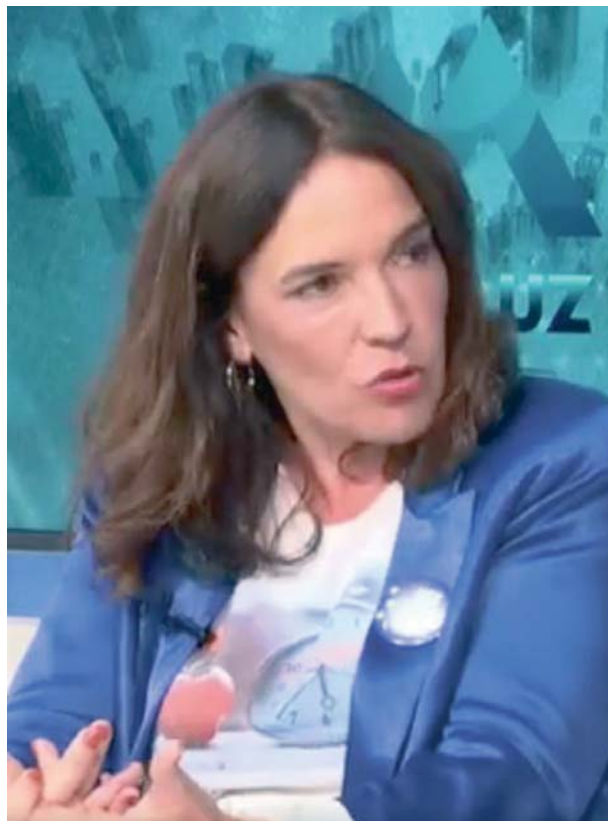
La eurodiputada Lina Gálvez en el programa Acento Andaluz de 7TV Andalucía.

Es posible que Trump use los aranceles para presionar en otras áreas de negociación. Puede que, por ejemplo, si quiere que España firme acuerdos de compra de armamento, decida imponer aranceles en aquello que más nos duela, como el campo andaluz”