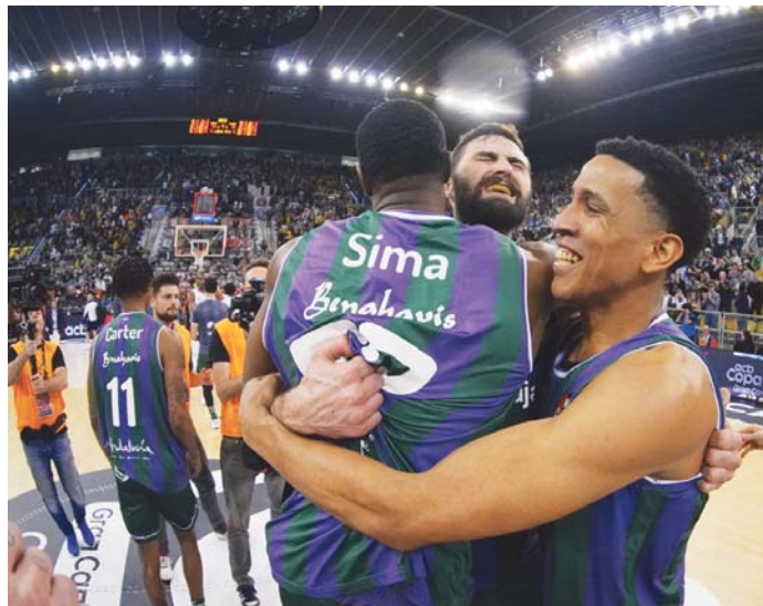
Unicaja se trae un nuevo título de Copa del Rey para sus vitrinas.

Sin embargo, el cuadro blanco respondió con dos triples de Abalde que apretaron el marcador (11-10, min.5) en sintonía con la igualdad en el juego. Navarro aceleraba la rotación, en busca de energía para mantener la intensidad defensiva,