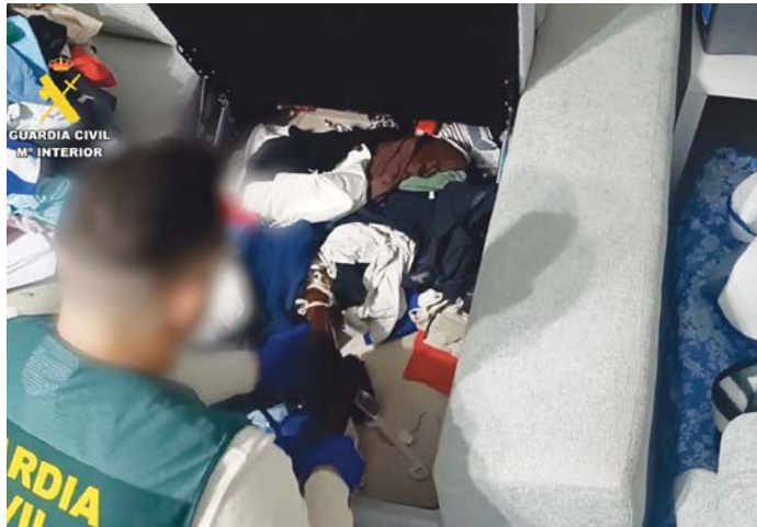
Las operaciones de la Guardia Civil se han desarrollado en diversas localidades. BC

Los detenidos que formaban este grupo criminal serían presuntamente los autores de, al menos, 18 robos en la provincia, haciendo uso de armas de fuego y de armas blancas para cometer los robos, en uno de los cuales, realizado en una vivienda ubicada en el municipi-