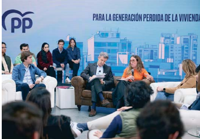
Alberto Núñez Feijóo, durante una reunión con representantes juveniles.

Paralelamente, el PP ha desplegado una batería de iniciativas con la vista puesta en los jóvenes, en especial sus medidas en materia de vivienda. En Génova están conven-