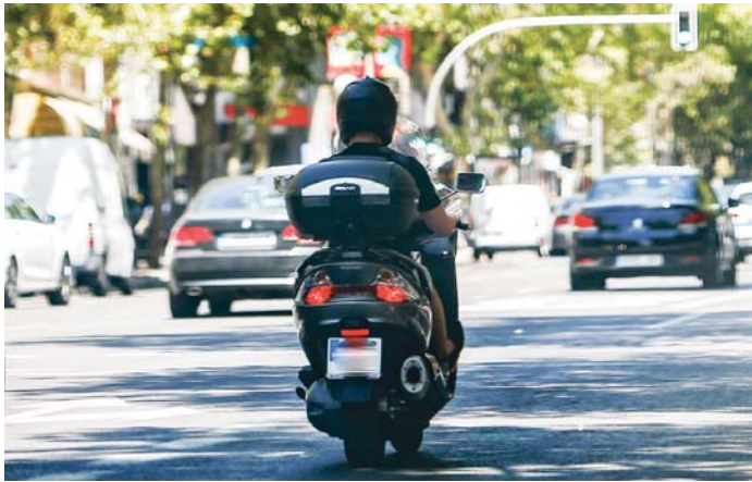
El tráfico rodado está presente en los estudios realizados por el ayuntamiento.

el documento sea aprobado de forma inicial por el Pleno ordinario del próximo 27 de febrero, el expediente será sometido a un periodo de exposición pública para que se puedan presentar alegaciones y será remitido a la Consejería de Medio Ambiente de la Junta de Andalucía para que emita su informe preceptivo. Tras la resolución de las alegaciones que pudieran recibirse, se procedería a la aprobación definitiva y a su publicación en el Bo-