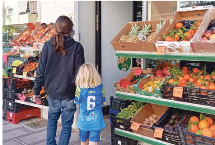
El crecimiento de los precios ha sido moderado, aunque Málaga sigue por encima de la media. ARROYO

EN el cómputo interanual del IPC de los Alimentos se observa que enero de 2024 ha registrado una tasa de crecimiento de 0,8%, frente al 6,8% que se registraba en enero del pasa-