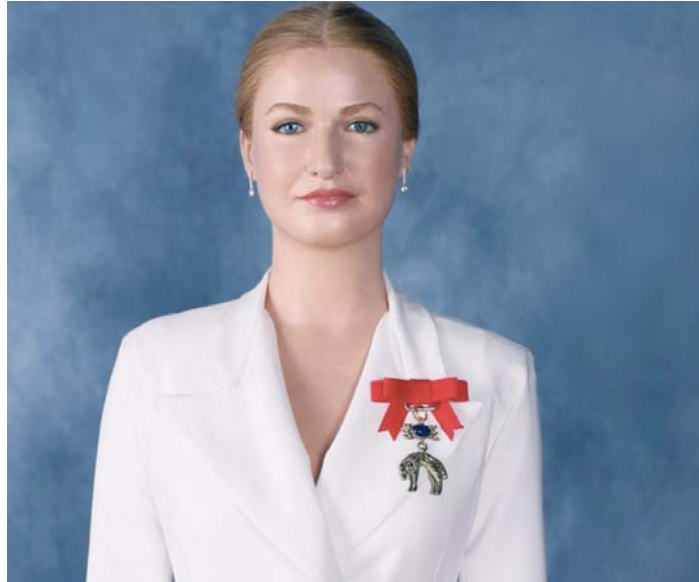
Figura representativa de la princesa Leonor instalada en el Museo de Cera de Madrid.

Y es que al igual que la Leonor real el 31 de octubre de 2023 -momento clave elegido para figurar en el Museo- la figura de cera luce un look idéntico al de la Princesa de Asturias en esa jornada histórica: su traje sastre blanco con blazer con solapa tipo esmoquin y pantalones rectos, el Toisón de Oro