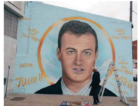
El artista realizando los últimos retoques al mural.