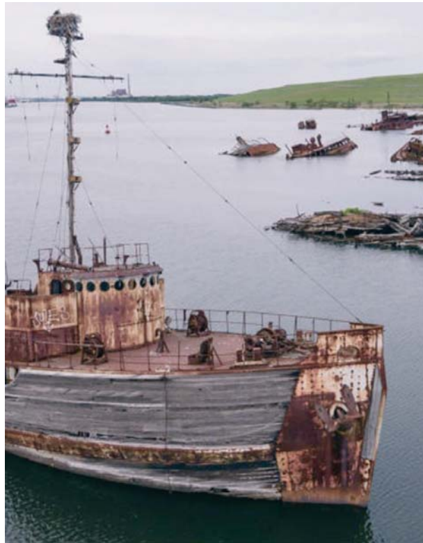
Zona de desguace de buques en el sudeste asiático.

Además las instalaciones de reciclado de buques autorizadas se ven afectadas porque el traslado y gestión irregular de los buques al final de su vida útil en centros no autorizados supone una situación de competencia a precios muy inferiores