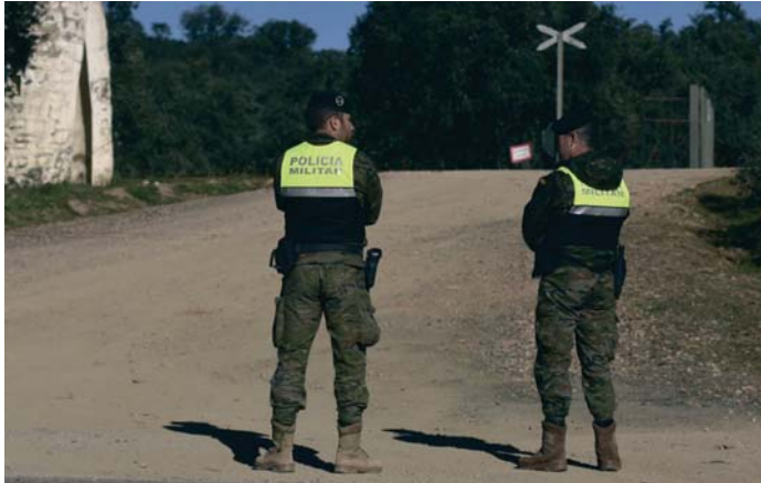
Militares acordonando la zona.

El juez dictó el pasado 29 de julio pasado un auto de procesamiento contra seis mandos de la base militar de Cerro Muriano, donde tiene su sede