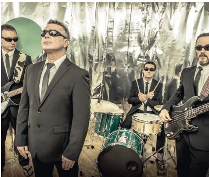
Los 'Chanclas', dispuestos a celebrar una gran fiesta en Sevilla por sus 35 años de carrera.

Asegura que para mantenerse y contar con ese apoyo incondicional del público pese al paso del tiempo es "muy importante la humildad y la salud musical que el grupo lo demuestra en directo" porque "la música tiene dos vertientes muy diferentes, una es tu discografía, lo que tu grabes y