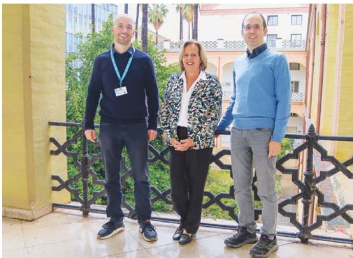
Investigadores responsables del proyecto para prevenir las conductas suicidas. IBIMA

En este sentido, la catedrática en el Departamento de Personalidad, Evaluación y